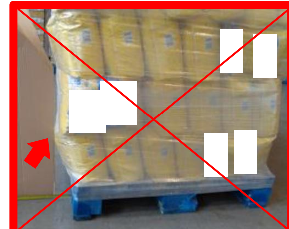
Merce oltre l'area del pallet