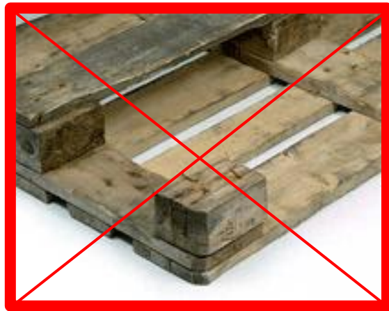
Tavola mancante, sotto