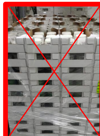
Scarso film ai lati e assente on top