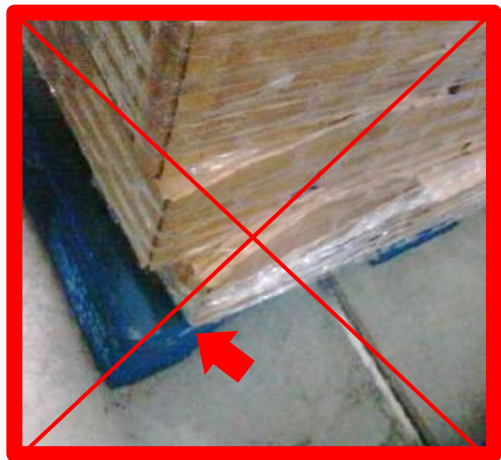
Film estensibile non vincolato al pallet