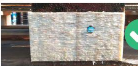
BLOCCHETTO CENTRALE NEUTRO (CON CHIODINO)

Il blocchetto può essere sia in legno sia in agglomerato, entrambi i materiali sono ammessi dal capitolato tecnico Epal.