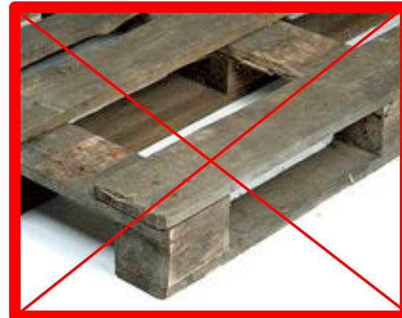
Tavola mancante, sopra