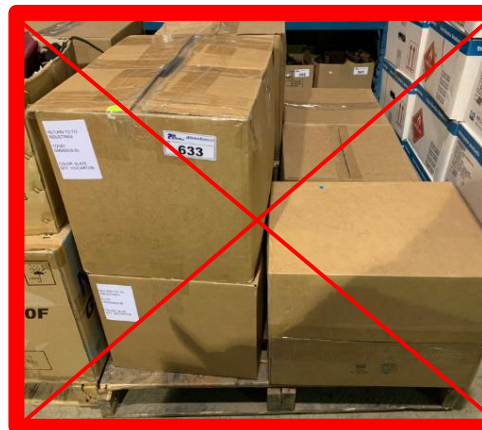
UDC non sigillata