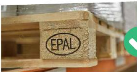
BLOCCHETTO IN AGGLOMERATO