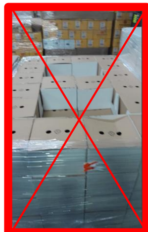
UDC non filmata sul lato superiore