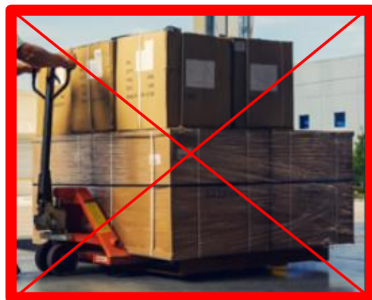
UDC fuori sagoma e non correttamente filmato