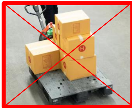
UDC non filmata e pallet non idoneo alla temp. controllata