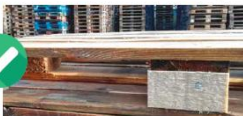
BLOCCHETTO CENTRALE NEUTRO (CON CHIODINO)