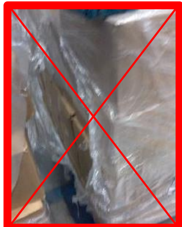
Film estensibile danneggiato